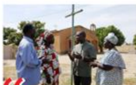
“ Dialoog hoopvol in dialoog met andere culturen en religies