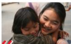
“ Solidariteit christenen wereldwijd de kansen geven die ze verdienen

Missio VZW, Vorstlaan 199, 1160 Brussel www.missio.be - info@missio.be Facebook.com/MissioBelgie