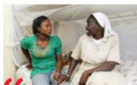
“ Ontmoeting om samen iets te doen